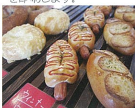
Bakery Kitchen Yamaguchi