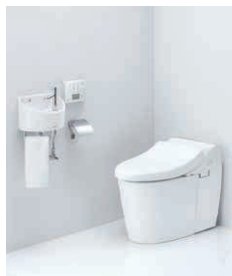
#SC1 パステルアイボリー